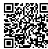
理学療法士及び 作業療法士法