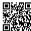
葵メディカルアカデミー 出願サイト

※出願登録後1週間以内に検定料の納入を済ませ、調査書（指定校・公募は推薦書も）を各校の入試事務局へ簡易書留で郵送、もしくは持参してください。