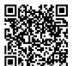
理学療法士 倫理綱領