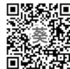
葵メディカルアカデミー 出願サイト