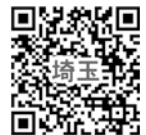
埼玉医療福祉専門学 出願サイト